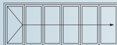
6-teiliges Element mit Drehflügel und fünf Faltflügeln