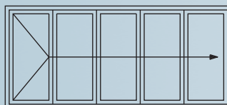
5-teiliges Element mit Drehflügel und vier Faltflügeln